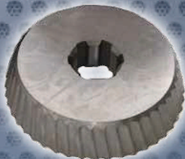
Art. Nr. 1927 - cutter