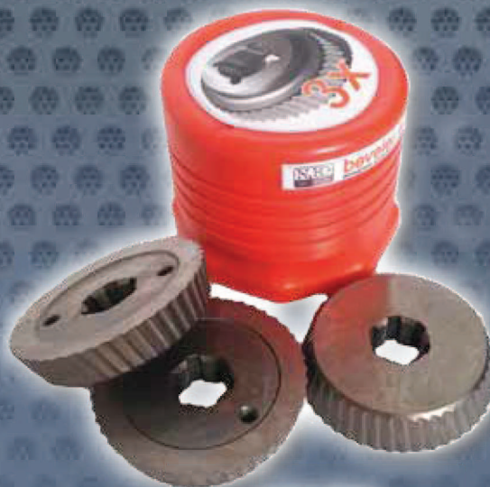
Art. Nr. 1928 set of 3 cutters Art. Nr. 1927 (price advantage)