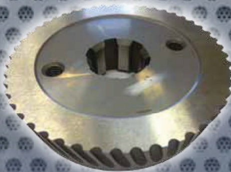
Art. Nr. 2135