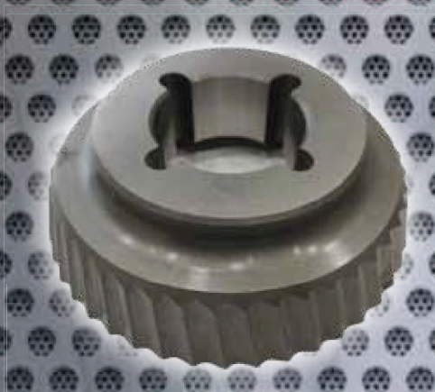
Art. Nr. 2137