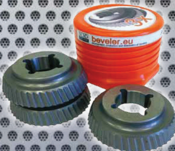
Art. Nr. 2134 set of 3 cutters ECO Art. Nr. 2137 (price advantage)